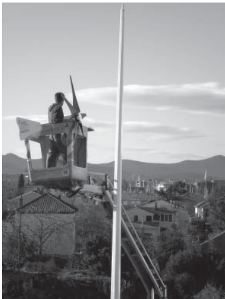
Dizaličar obavlja završne radove – vjetroturbina će se uskoro zavrtjeti

Zbog svega navedenog treba se složiti s riječima našeg ravnatelja Tihomira Tomčića : U pogledu primjene sunčeve energije, ali i općenito „zelenih“ energija, Strukovna škola Vice Vlatkovića zaista je postala centar izvrsnosti.