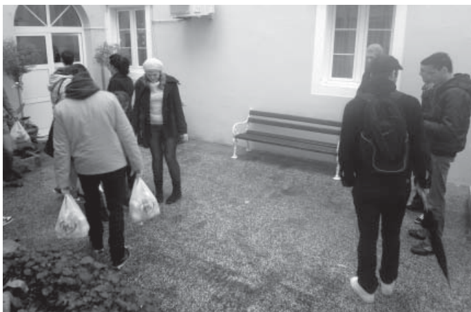
Učenici naše Škole u dvorištu Doma sv. Frane s božićnim poklonima