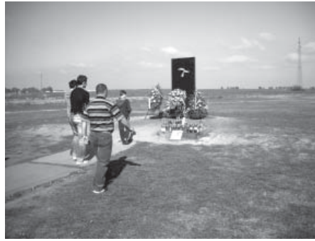
Kod spomen - obilježja na Ovčari zapalili smo svijeću i pomolili se za sve vukovarske žrtve

Posjetili smo i Spomen - dom Ovčara kao i dva kilometra udaljenu masovnu grobnicu na kojoj su mučkom smrću pogubljeni ranjenici i djelatnici Opće bolnice Vukovar, njih 262. Najmlađa žrtva među njima imala je 16, a najstarija 77 godina. Zastrašujuće je i to da je među pogubljenima bila i trudnica u osmom mjesecu trudnoće. Spomen - dom Ovčara konstruiran je kao mjesto stalne tame. Po podu su ugrađene čahure, a na plafonu se nalazi onoliki broj zvijezda koliko je ljudi ubijeno na tom mjestu. Po zidovima se izmjenjuju njihove slike, kao simbol njihove stalne prisutnosti, a ispod tih slika je slama na kojoj su poredani predmeti koje su imali uza se kada su ubijeni. Strašna je spoznaja o svemu tome, načinjena od surovih brojki, potresnih slika koje svjedoče o bliskoj nam prošlosti. Još strašnije je pomisliti kako je bilo onima koji su to proživjeli, koji su izgubili svoje bližnje, strahovali da će i oni biti ubijeni, koji su gledali svojim očima kako im se ruši Grad i kako im se ruši život ne mogavši ništa učiniti. Kod spomenika na Ovčari