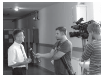
Ravnatelj daje izjavu za medije na otvaranju SEC-a i EE info centra