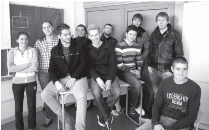
Dio redakcije „ Stručka “