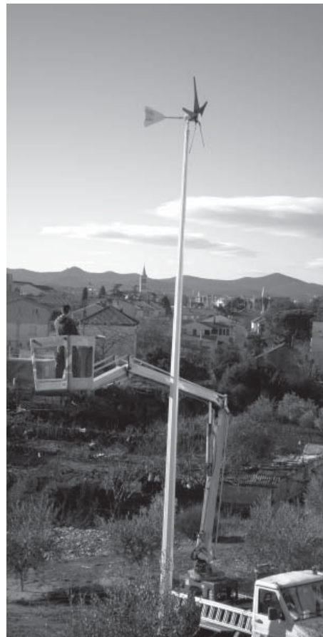
Vjetrenjača snage 1 KW i promjera 3 m u punom sjaju

Ova dva projekta promovirat će korištenje obnovljivih izvora energije i zaštitu okoliša, a nastavak su aktivnosti koje je Strukovna škola Vice Vlatkovića započela s projektima