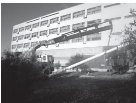
Dizalica na zadatku – podizanje stupa vjetrenjače