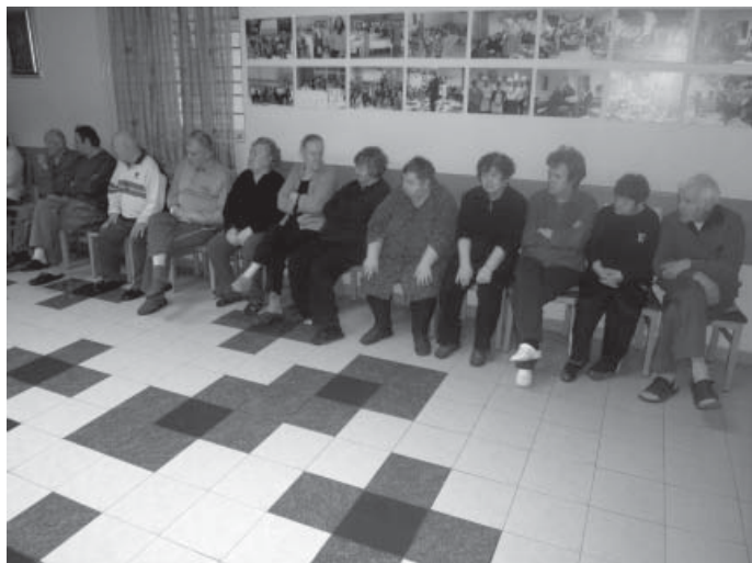
Štíćenici Doma sv. Frane uživaju u prigodnom blagdanskome umjetničko-glazbenome programu koji smo im pripremili