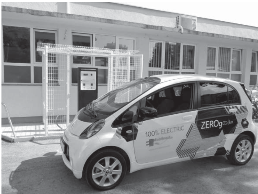
Punionica je otvorena simboličnim punjenjem ustupljenog Citroenovog električnog automobila C-ZERO

Riječ je o edukativno – demonstracijskoj punionici na kojoj će učenici naše Škole učiti postavljati