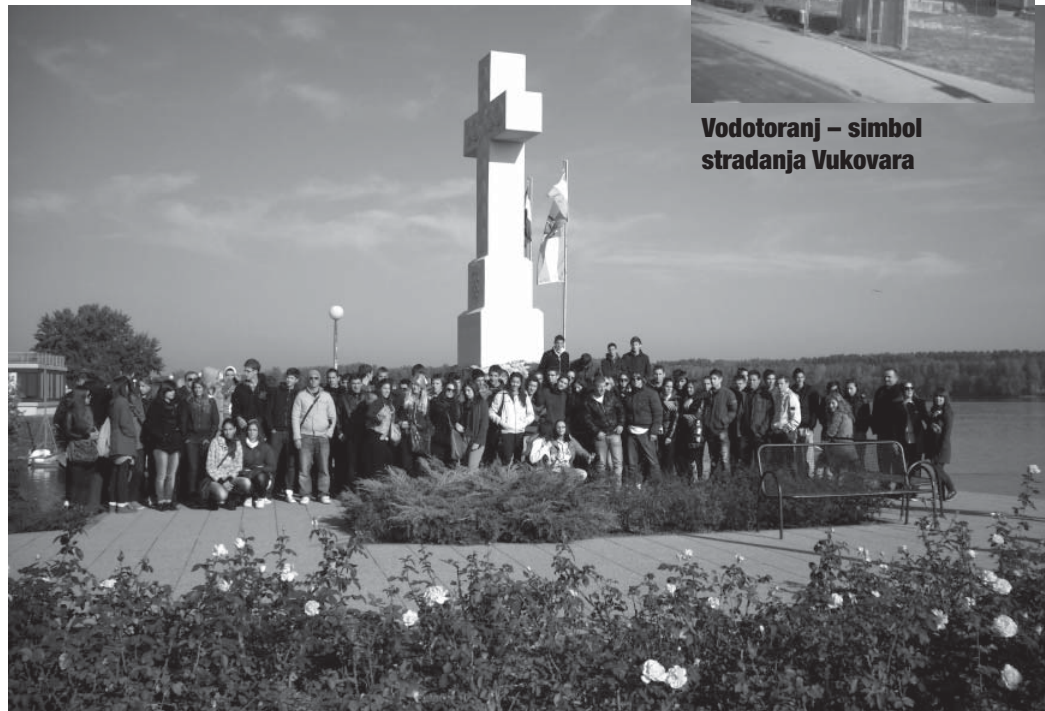
Učenici naše Škole ispred bijelog križa na ušću Vuke u Dunav

Najprije smo posjetili vukovarsku Bolnicu. Na ulazu u Bolnicu pažnju plijeni veliki crveni križ s crnim rupama koje svjedoče da je agresor tijekom bitke za Vukovar bombardirao i ono što se nikako, ni po kojem zakonu, ni moralnom ni pravnom,