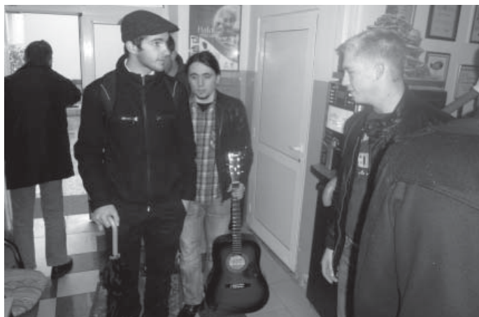
Ulazak u Dom – skrbeći o starima, nemoćnima i potrebitima izgradili smo se kao osobe