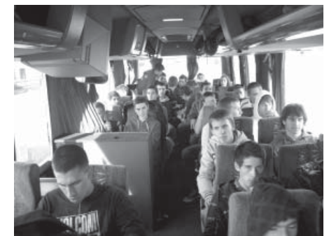
Povratak u Zadar – dojmovi s putovanja u Vukovar vrlo su intenzivni