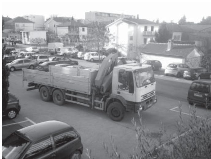
Dolazak dizalice – vjetrenjača će uskoro biti postavljena