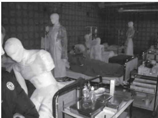
Vukovarska Bolnica dočarava sablasnu atmosferu rata