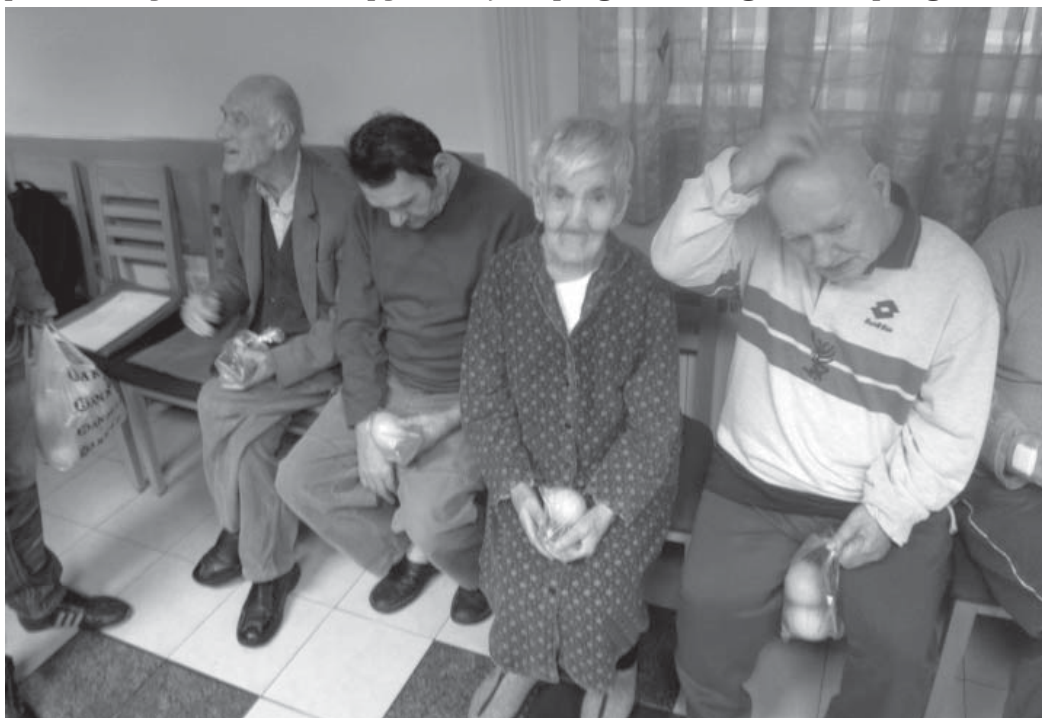
Sa štičenicima Doma za odrasle osobe sv. Frane podijelili smo radost i veselje Božića

Učenici Strukovne škole Vice Vlatkovića su radost Božića po drugi put podijelili sa štičenicima Doma za odrasle osobe sv. Frane. Susret štičenika Doma sv. Frane i učenika Strukovne škole Vice Vlatkovića protekao je veselo i raspjevano, uz prigodni blagdanski program