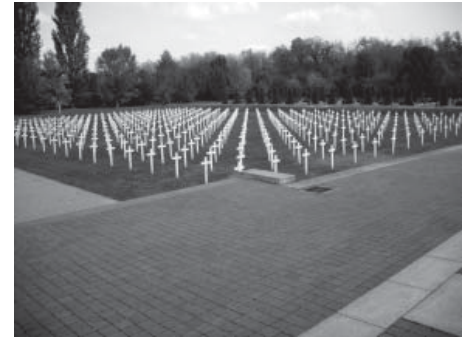
Bilo bi bolje da ne postoji – Memorijalno groblje

Unatoč svemu, Vukovar ipak živi iako je bol i strahota stradanja vidljivo prisutna u očima plemenitog slavonskog čovjeka. Svojedobno je vukovarski ratni report-