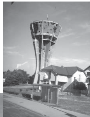
Vodotoranj – simbol stradanja Vukovara