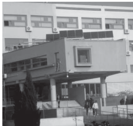
Izgradnju fotonaponske centrale financirala je Zadarska županija

Na ravni krov iznad zbornice naše Škole ove je jeseni postavljena fotonaponska centrala snage 1 KW koja će u prvoj fazi proizvoditi električnu energiju za potrebe Škole, a u drugoj fazi će biti uključena u elektro-distribucijski sustav Republike Hrvatske. Izgradnju fotonaponske centrale financirala je Zadarska županija. U sklopu ovog projekta uskoro će ispred Škole