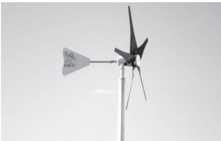
Vjetrenjača snage 1 KW i promjera 3 m koja će proizvoditi električnu energiju za potrebe Škole