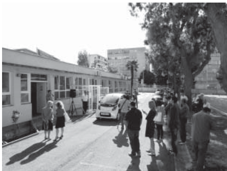
Nazočni na svečanom otvaranju solarne punionice