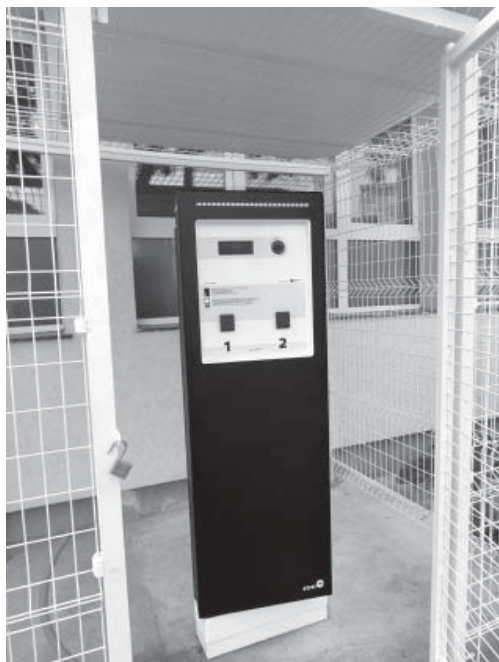
Prva solarna punionica električnih automobila u Republici Hrvatskoj nalazi se ispred Centra za solarnu energiju