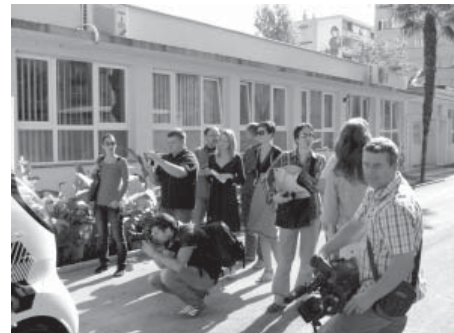
Pažnju „sedme sile“ privukla je prva solarna punionica za električne automobile