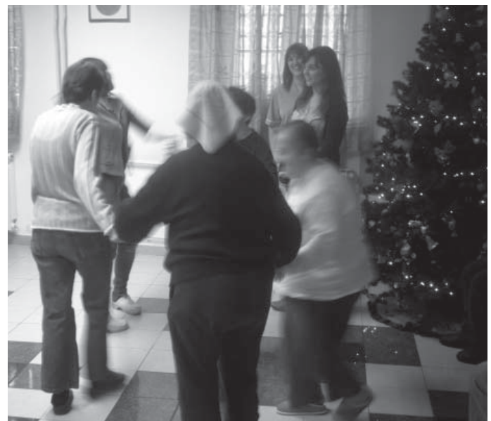
Pjesma naših učenika je potakla štíćenike Doma na ples

sme sobe bolesnih i nemoćnih štíćenika, podijelili i njima darove te im tako uljepšali Božić. Ovaj susret humanog karaktera bio je vrlo važan i za nas, učenike Strukovne škole Vice Vlatkovića jer smo se, dijeleći radost Božića starima, nemoćnima i potrebitima, izgradili kao osobe.