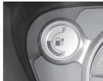
„Rezervoar“ Citroena C-ZERO napunjen u solarnoj punionici električnih automobila

janje i montažu, ali koja će biti na raspolaganju i svim vlasnicima električnih vozila. Upotreba vozila na električni pogon znači brigu za okoliš jer ona smanjuju