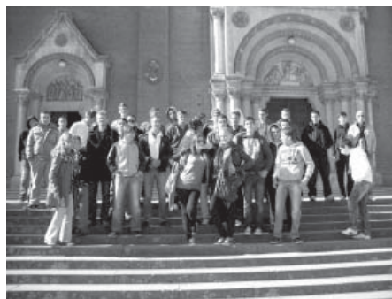
Ispred đakovačke Katedrale