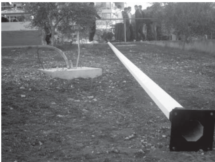
Postolje i stup buduće vjetrenjače